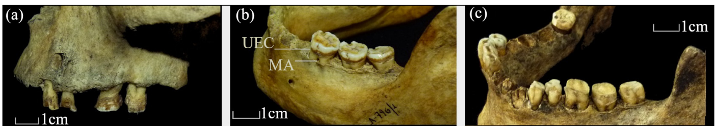
FIGURA 2. Expresión de la periodontitis en las arcadas dentales. (a) Individuo MFM 796 mandíbula izquierda, grado 3; (b) Individuo MFM 795, maxilar izquierdo, grado 2; (c) Individuo Shamakush caja 7, mandíbula izquierda, grado 3. Referencias: UEC: unión esmalte-cemento; MA: margen alveolar.

Los resultados indican que el 36% (9/25) de la muestra presenta periodontitis (Tabla 2), con una distancia entre la UEC y el MA superior a 2mm y cambios en la morfología del MA. El 36% (9/25) de los individuos presentó algún grado de periodontitis en la dentición posterior y solo el 12% (3/25) en la dentición anterior, sin identificarse diferencias estadísticamente significativas ( p=0,09 ). Por otra parte, el porcentaje correspondiente al Grado 2 fue menor (20%; 5/25) que el del Grado 3 (28%; 7/25) y ningún individuo evidenció Grado 4, considerado como periodontitis severa (Figura 2). El 16% (4/25) de los individuos presentó Grado 2 en la dentición posterior y solo un 4% (1/25) en la dentición anterior. Por su parte, se registró periodontitis Grado 3 en el 20% (5/25) y 8% (2/25) de los individuos para la dentición posterior y anterior, respectivamente (Figura 2). Por último, el Grado 1 (i.e., alvéolo sin periodontitis) se observó en el 64% (16/25) de los individuos (Tabla 2).