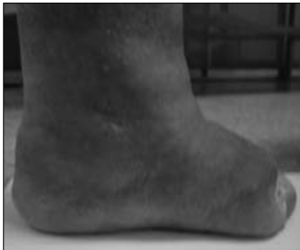
Figura 4. Incisión y cierre del muñón con un colgajo largo modificado.