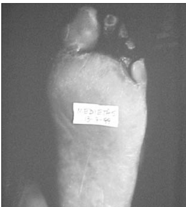
Figura 13. Indicación de amputación transmetatarsiana en la planta de antepié.