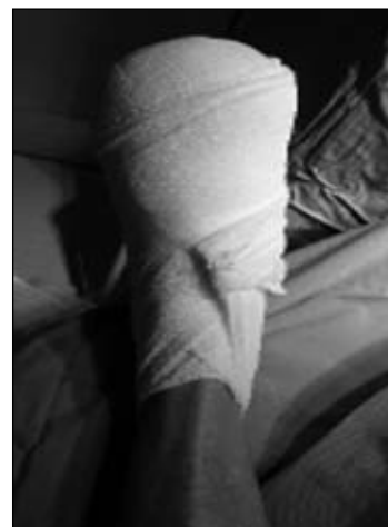
Figura 29. Vendaje.