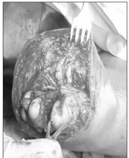
Figura 26. Toma de la cabeza con una pinza de fuerza.