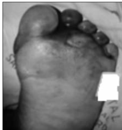
Figura 8. Indicación de amputación transmetatarsiana en la planta del antepié.