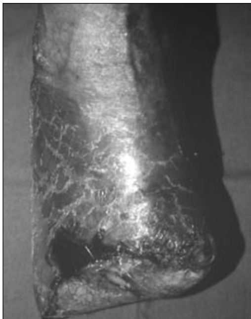
Figura 32. Necrosis de los bordes de la herida.