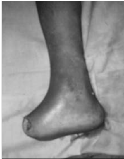
Figura 2. Cierre del muñón con la incisión clásica.