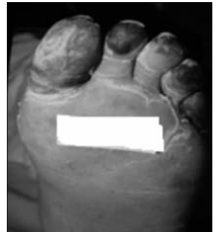
Figura 9. Indicación de amputación transmetatarsiana en la planta del antepié.