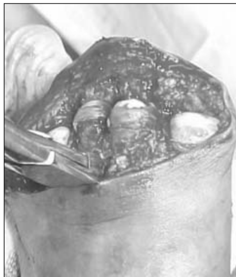
Figura 25. Resección a nivel de los cuellos metatarsianos con cizalla.