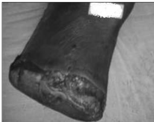
Figura 31. Dehiscencia de una herida reciente, antes del mes.