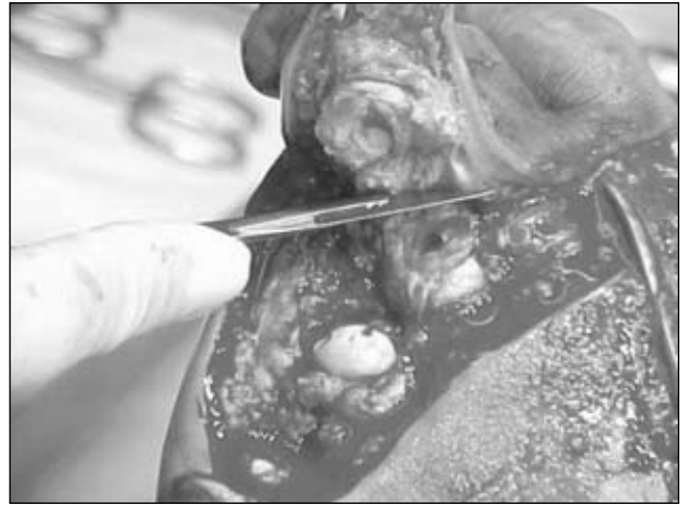
Figura 21. Sección del segundo y el tercer dedo.