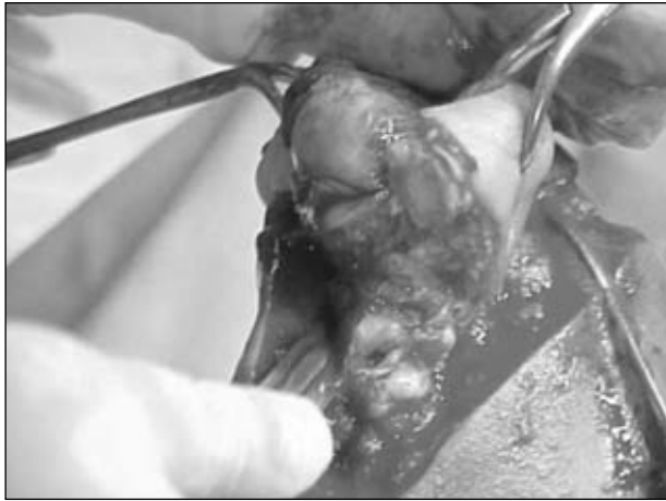
Figura 20. Toma del hallux con una pinza de fuerza.