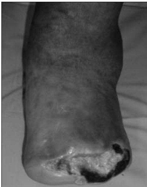
Figura 33. Dehiscencia de una herida de larga evolución.