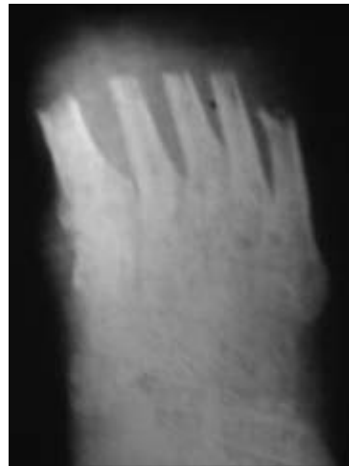
Figura 5. Radiografía correspondiente al colgajo largo modificado.