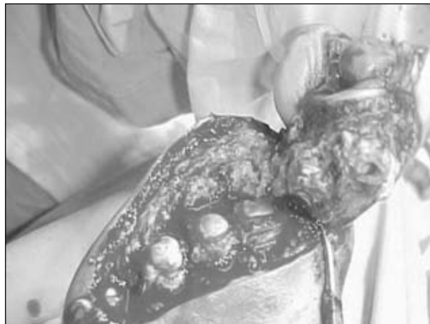
Figura 22. Sección del cuarto y el quinto dedo.