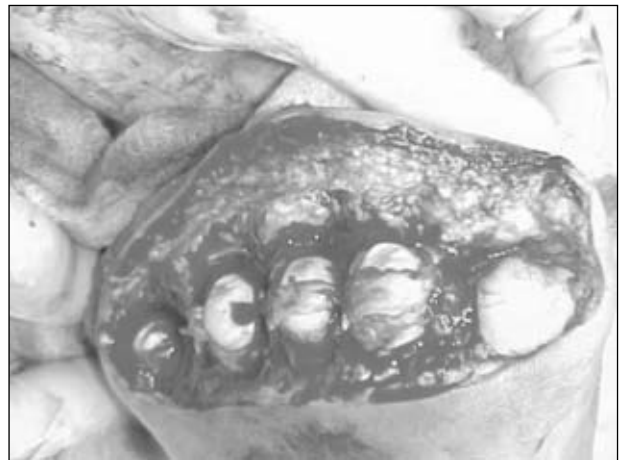
Figura 23. Vista horizontal de las cinco cabezas metatarsianas.