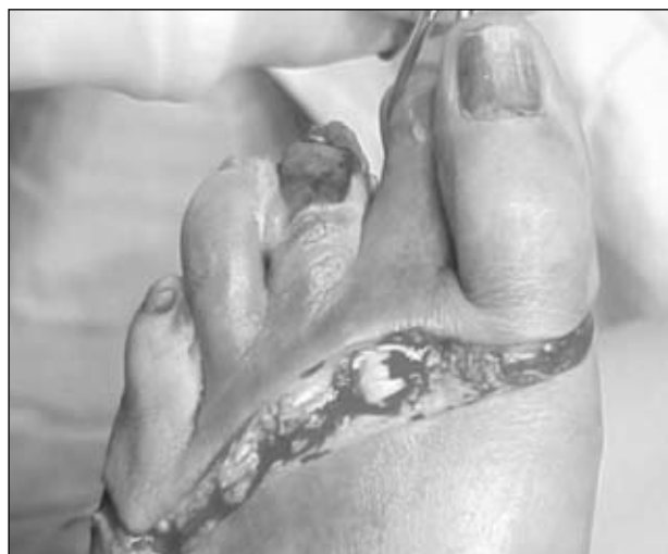
Figura 18. Incisión quirúrgica en el dorso del antepié.

Se emprolijan los bordes óseos con una gubia delicada.