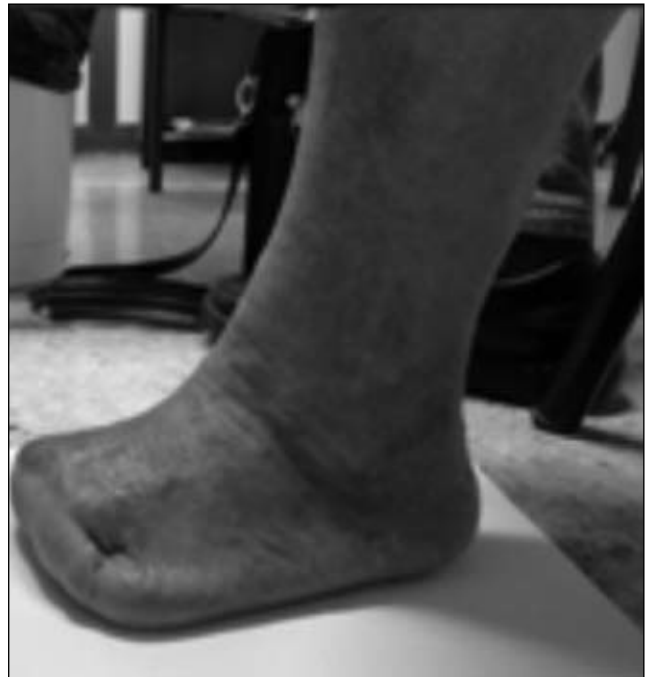
Figuras 39 y 40. Longitud del colgajo dermoepidérmico del muñón.

grupos anteriores pero que, en nuestra experiencia, se presenta esporádicamente.