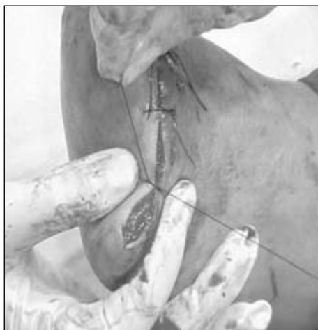
Figura 27. Cierre del muñón.

tos separados de nailon 000 y aguja curva, sin dejar drenajes. Se efectúa un vendaje compresivo seco y grande; gasa seca abundante y venda camiseta en ochos de modo de comprimir el lecho (Fig. 29).