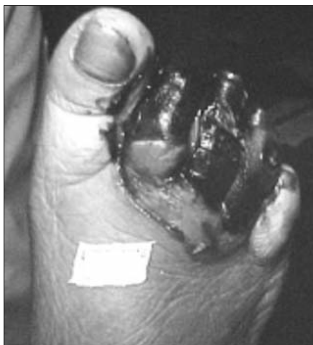
Figura 12. Indicación de amputación transmetatarsiana en el dorso del antepié.