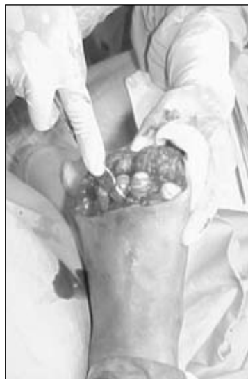
Figura 24. Legrado de los cuellos metatarsianos.