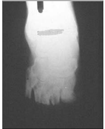
Figura 3. Radiografía correspondiente a la incisión clásica.