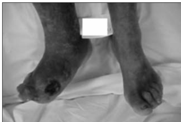
Figura 14. Indicación de amputación transmetatarsiana, secular en el dorso del antepié.