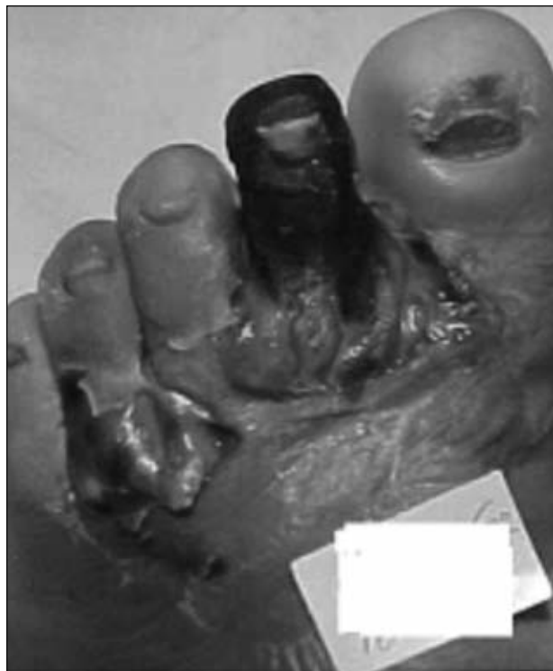
Figura 10. Indicación de amputación transmetatarsiana en el dorso del antepié.