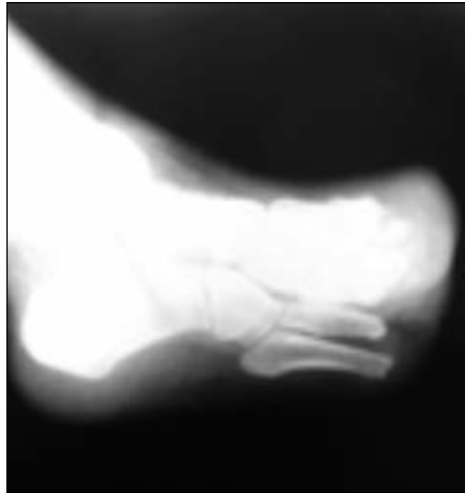
Figuras 37 y 38. Radiografías posoperatorias (véase la longitud de los metatarsianos).