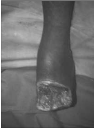
Figura 1. Incisión clásica.