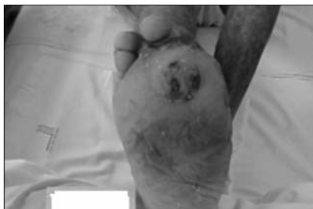
Figura 16. Indicación de amputación transmetatarsiana, secular en la planta del antepié.