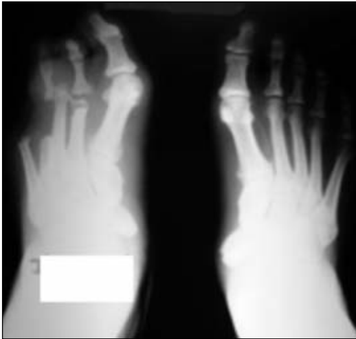
Figura 36. Radiografía preoperatoria.