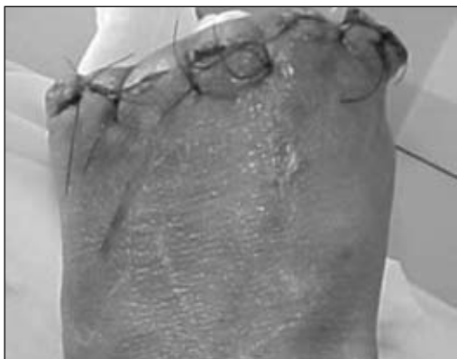
Figura 30. Livideces por puntos comprimidos.

El largo de la planta debe ser el que se observa en las fotografías (Figs. 34 y 35), ya que de esta única forma, el apoyo será en el colgajo dermoepidérmico del metatarso (Figs. 36 a 40).