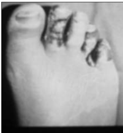
Figura 7. Indicación del nivel de amputación transmetatarsiana en el dorso del antepié.