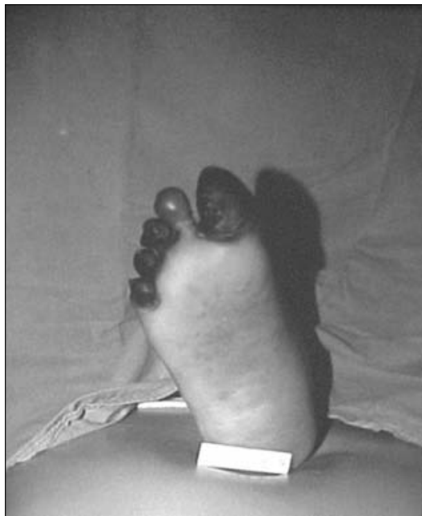
Figura 11. Indicación de amputación transmetatarsiana en la planta de antepié.