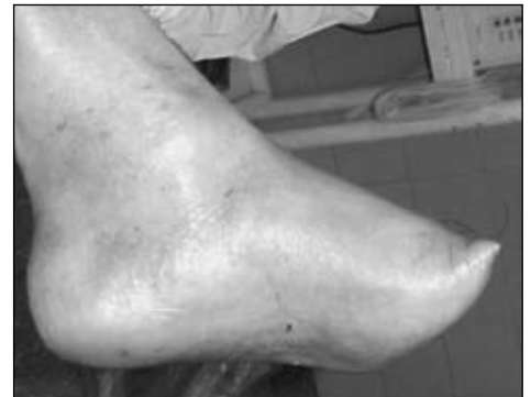
Figura 6. Incisión y cierre del muñón con el colgajo largo modificado.