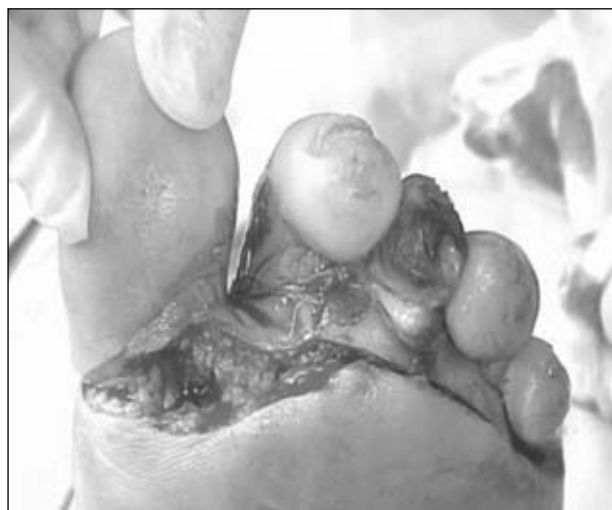
Figura 19. Incisión quirúrgica en la planta del antepié.