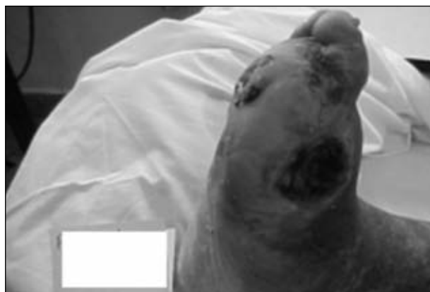
Figura 15. Indicación de amputación transmetatarsiana, secular.