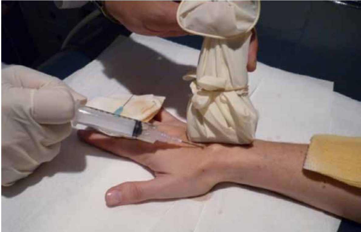
Figura 2. Imagen del procedimiento.

de edad de 31 años (rango de 21 a 48). Se evaluaron 15 muñecas derechas y 17 muñecas izquierdas. En 19 (59,3%) pacientes, el ganglión estaba en el miembro dominante. En todos los casos, el ganglión se encontraba sobre el ligamento escafolunar. Ningún paciente hacía trabajos pesados ni forzados, ni deportes de impacto; las ocupaciones eran las siguientes: 14 (43,75%) telefonistas que trabajaban en un call center, 6 estudiantes (18,75%), 5 amas de casa (15,62%), 2 secretarías (6,25%), 2 abogadas (6,25%), una médica (3,12%) y un radiólogo (3,12%). El promedio del tamaño de los quistes fue de 17,6 mm (rango de 10 a 26 mm) de longitud por 12,8 mm de ancho (rango de 8 a 18 mm). Se utilizaron dos tipos diferentes de aguja según si la mucina era más bien líquida (aguja fina Terumo® de 23 g x 25 mm) o consistente (aguja Neojet® de 18 g x 50 mm). Antes del procedimiento, los pacientes refirieron un promedio de 7,75 puntos en la escala de dolor (rango de 6 a 9) y el puntaje DASH promedió 2,90 (rango de 2,02 a 3,86). Diecinueve (59,37%) no tenían ninguna cirugía previa (grupo 1) y 13 (40,62%) ya habían sido sometidos a un procedimiento invasivo (grupo 2) y la recidiva había sido diagnosticada por ecografía. A todos, se les indicó retornar a sus actividades y tareas habituales al día siguiente del procedimiento.