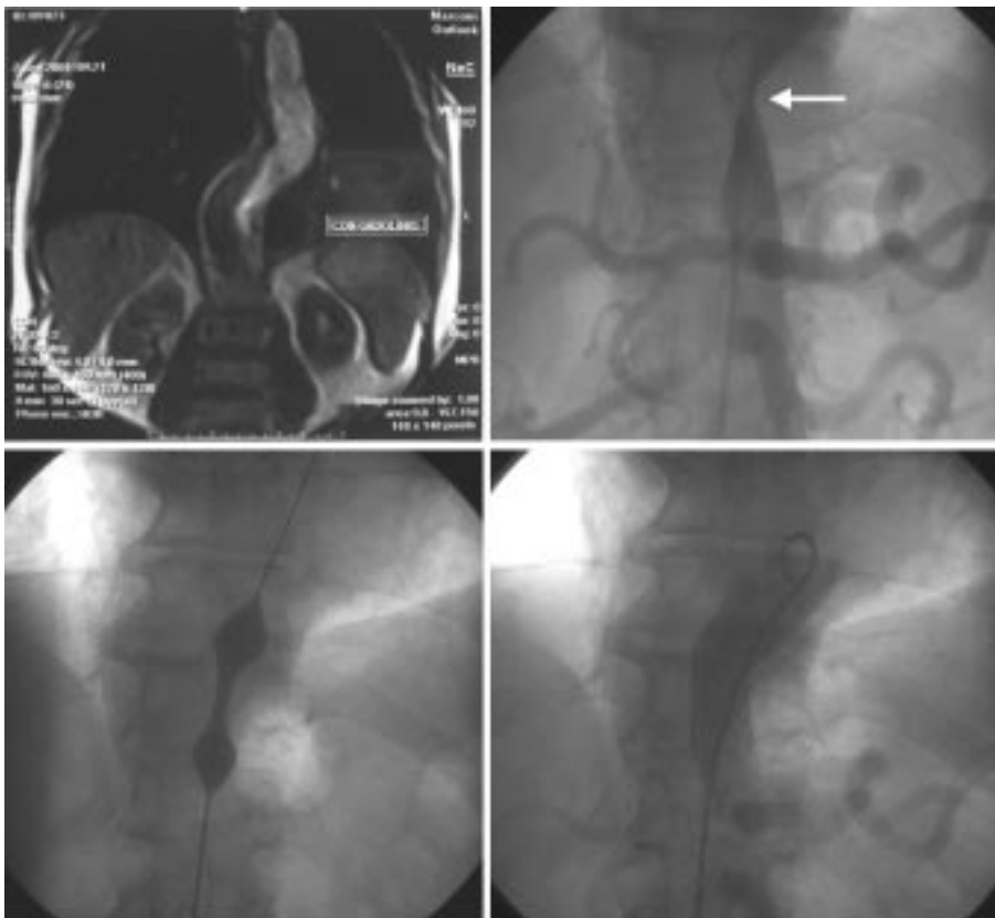
Fig. 2. Imágenes angiográficas: Arriba izquierda: angiorresonancia con gadolinio. Arriba derecha: angiografía de contraste. La flecha señala la compresión de la luz verdadera por encima del origen de las renales. Abajo izquierda: impronta del balón inflado. Abajo derecha: stent ya impactado.

comprimir estructuras vecinas aun con bajo flujo, ya que la tensión depende de la presión en la cavidad, dada en parte por el flujo, pero también del diámetro de la cavidad (ley de Laplace). Cuanto más dilatada la falsa luz, mayor tensión y mayor posibilidad de rotura y de compresión de estructuras vitales, como la luz verdadera de la aorta abdominal.