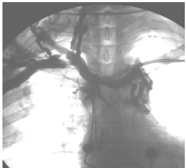
Fig. 1. Flebografía del miembro superior derecho en la que se observa oclusión de las venas subclavia derecha y cava superior, con abundante circulación colateral.

Ante la imposibilidad de implantar el sistema por vía endovascular se optó por la vía transauricular por toracotomía mínima, conservando los catéteres de marcapasos funcionantes para estimulación y sensado.