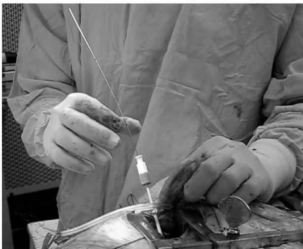
Fig. 2. Colocación del introductor peel-away a través de la jareta en la aurícula derecha y posicionamiento del catéter en el ventrículo derecho.

En el procedimiento quirúrgico, por toracotomía anterior derecha extrapleurál, se reseco el cuarto cartílago, se liberó el pericardio y se realizó una jareta en la cara lateral de la aurícula derecha. Se punzó la jareta, se colocó un introductor peel-away y se posicionó un catéter Guidant® 0137 en la punta del ventrículo derecho. Los umbrales fueron óptimos (Figura 2). Posteriormente se tunelizó el catéter desde la toracotomía, por vía preesternal, hasta el bolsillo del marcapasos donde se conectó al cardio desfibrilador junto al catéter auricular anterior. El catéter ventricular del marcapasos quedó abandonado. La posición final del sistema se evaluó por radioscopia (Figura 3).