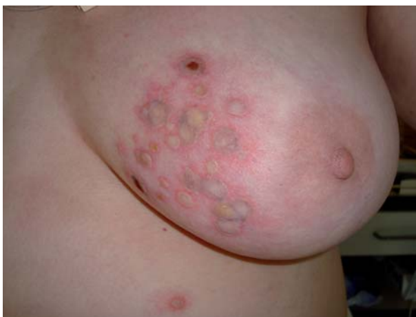
Figura 1. Lesiones ampollosas en mama izquierda sospechosas de ectima gangrenoso o de herpes zóster diseminado.

Ectima gangrenoso por Aeromonas hydrophila . Mujer de 53 años diabética tipo I y con diagnóstico de leiomioma uterino de alto grado (estadio IV) en 2010 bajo tratamiento quimioterápico, acudió al Servicio de Urgencias de la Fundación Instituto Valenciano de Oncología (FIVO) por fiebre ( > 38^{\circ}\text{C} ) y lesiones vesículo-ampollosas en la mama izquierda, diseminadas al tronco y a las extremidades (Figura 1). La biopsia mostró vasculitis de vasos de pequeño calibre en dermis superficial y profunda (Figuras 2 y 3). En los cultivos de las lesiones se aisló Aeromonas hydrophila sensible a los antibióticos \beta -lactámicos (amoxicilina-clavulánico CIM < 4/12 \mu\text{g/ml} , ceftacidima CIM < 1 \mu\text{g/ml} ), a las quinolonas (ciprofloxacina CIM < 0,12 \mu\text{g/ml} ), a los carbapenems (imipenem CIM < 1 \mu\text{g/ml} ) y a los aminoglucósidos (gentamicina CIM < 4 \mu\text{g/ml} ). La taxonomía del género Aeromonas ha sido revisada recientemente, así como los mecanismos de patogenicidad (1). Aeromonas hydrophila es considerado un microorganismo causante de gastroenteritis aguda (2), pero también productor de lesiones cutáneas en pacientes inmunodeprimidos (3).