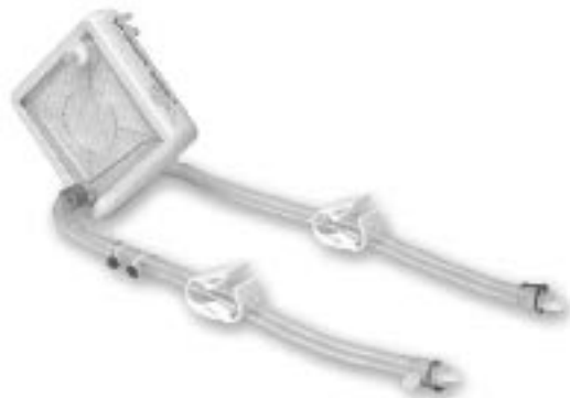
Figura 2. El oxigenador Novalung se vende a €5.600