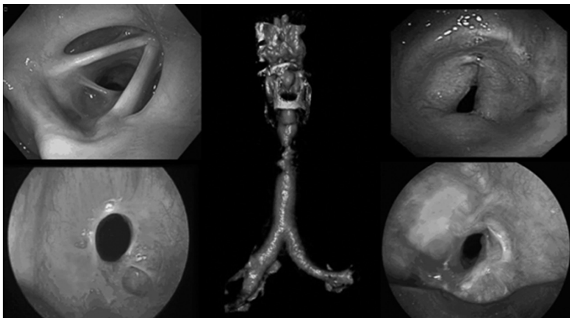
Figura. Tipos morfológicos de una estenosis laringotraqueal. Arriba izquierda: LTS excéntrica debida a GPA compromete la comisura posterior a nivel glótico (McCaffrey estadio IV). Abajo izquierda: SGS idiopática circunferencial, simple; Panel medial: Reconstrucción en 3 D, la CT muestra una PITS compleja, en reloj de arena; Arriba a la derecha: estenosis post traqueostomía triangular, con forma de A justo por debajo del cartílago cricoides; Abajo a la derecha: PITS compleja, circunferencial; La broncoscopia con luz blanca no pudo identificar daño del cartílago; frecuentemente la recurrencia fue debida a condritis (malacia) identificable por ecografía endobronquial radial.

de araña (web-like), circunferencial, son términos utilizados para describir estenosis concéntricas segmentarias cortas, < 1cm en longitud vertical sin daño del cartílago, y están comúnmente causada por isquemia de la mucosa tras una intubación orotraqueal pero podrían ser idiopáticas o secundarias a enfermedades auto inmunes (Figura). Este tipo de estenosis usualmente se resuelve dilatación asistida con láser o electrocauterio. Por el contrario, el término estenosis compleja se usa para describir estenosis con lesión de la pared traqueal, con segmentos estenóticos > 1 cm, úlcera contráctil circunferencial frecuentemente con forma de reloj de arena, o estenosis asociada con malacia que resulta de una condritis. En pacientes que no son candidatos quirúrgicos, la inserción de stents se considera la opción terapéutica de elección para estenosis complejas (Figura). La tomografía computada y la broncoscopia con luz blanca pueden ser limitadas para diferenciar estenosis simples de estenosis complejas, especialmente cuando los tejidos estenóticos hipertróficos son prominentes y no se puede visualizar la integridad del cartílago (Figura). Las tecnologías de imágenes de mayor resolución tales como el ultrasonido radial pueden ayudar a diferenciar más claramente si existe daño cartilaginoso 16 . Un subgrupo de estenosis complejas que tiene una morfología específica es la estenosis pseudoglótica o con forma de A, causada