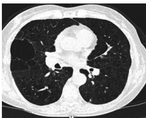
Imagen 3. TC Tx: enfisema panlobulillar, bulla subpleural en LSD de paredes finas, sin nivel hidroaéreo en su interior.

su interior. Se revisaron imágenes previas (Imagen 3) en las que se evidenció misma bulla de paredes finas, sin nivel hidroaéreo en su interior. Se realizó toma de cultivos, recibiendo tratamiento antibiótico