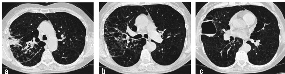
Imagen 2a, b y c: TC Tx: enfisema panacinar con complejos bullosos bilaterales, consolidación en lóbulo superior derecho asociado a bulla con contacto pleural que presentaba nivel hidroaéreo en su interior.

(TC de tx) (Imagen 2a, 2b y 2c): enfisema panacinar con complejos bullosos bilaterales, consolidación en lóbulo superior derecho asociado a bulla con contacto pleural que presentaba nivel hidroaéreo en su interior