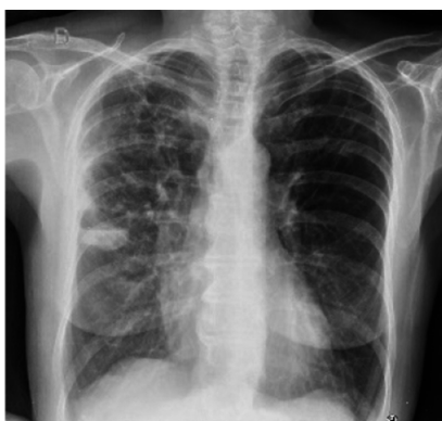
Imagen 1. Rx Tx: imagen radiolúcida en tercio medio hemitórax derecho con nivel hidroaéreo en su interior.

Mujer de 62 años de edad con antecedentes de hipertensión arterial, ex tabaquista de 60 paquetes/año, enfermedad pulmonar obstructiva crónica (EPOC) Grado 3 GOLD C (VEF1 0.970 lts, 47%), exacerbadora frecuente, en tratamiento con fluticasona 250 ug/salmeterol 25 ug 1 aplicación cada 12 hs. Consultó por presentar dolor pleurítico derecho asociado a disnea mMRC 2. Se internó, se realizaron exámenes complementarios evidenciándose leucocitosis 18100 (80% neutrófilos segmentados), serología HIV no reactivo, radiografía de tórax (Rx) (Imagen 1) y tomografía computada de tórax