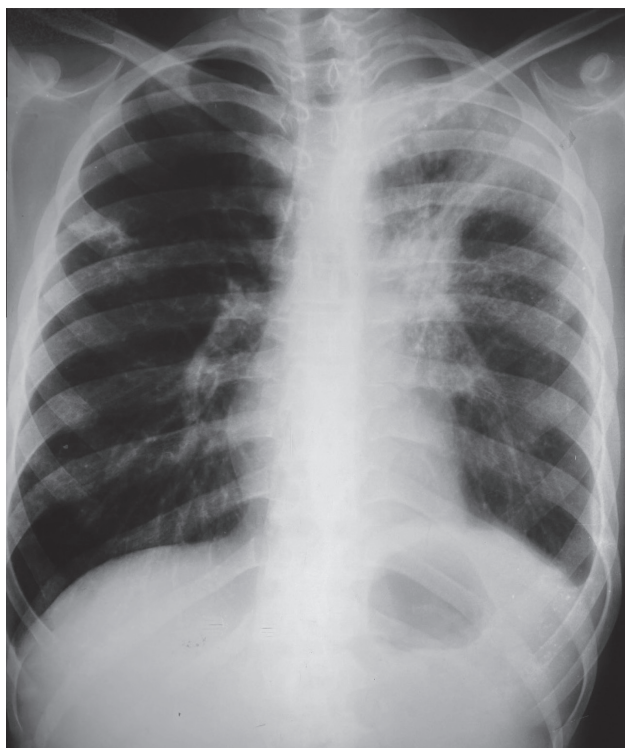
Figura 1. RX Tórax (fte)

Radiología de tórax (Rx): lobitis superior izquierda, con cavidades y componente atelectásico. (UCC) Adenomegalias en hilio izquierdo. Figura N° 1