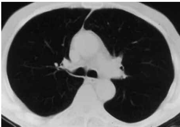
Tomografía computada de tórax - corte en el centro del tórax.