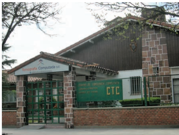
Fig. 11: Primer centro de Tomografía Computada de Salta.