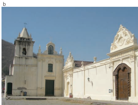
Fig. 1: Dos vistas del Convento de San Bernardo: (a) a comienzos del siglo XX y (b) tal como se encuentra en la actualidad.