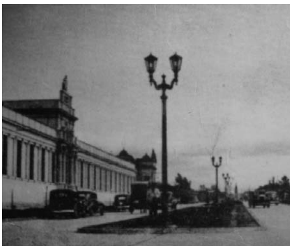
Fig. 5: Hospital del Milagro en la década de 1930.

que además esto fue acompañado por avances tecnológicos en los equipos de la época.