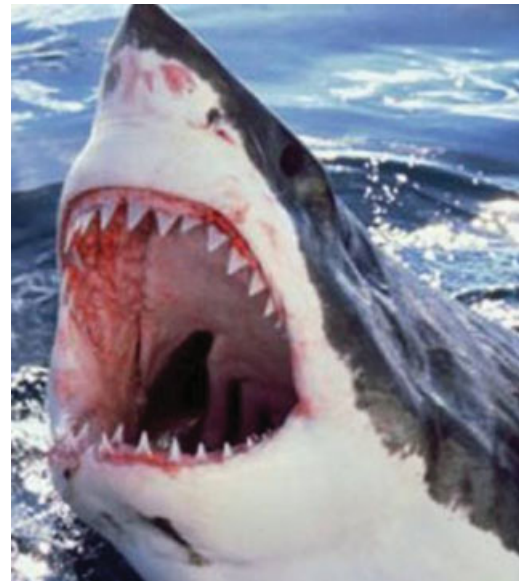
Fig. 2 Gran tiburón blanco en su hábitat natural.

Fig. 1 Incidencia oblicua ampliada del tránsito esofágico baritado, donde se observa en el tercio medio del esófago una imagen exofítica y ulcerada que disminuye parcialmente su luz. Dicho hallazgo se correspondió con un adenocarcinoma de esófago. Esta imagen nos recuerda al gran tiburón blanco, con su mandíbula abierta y sus afilados dientes.