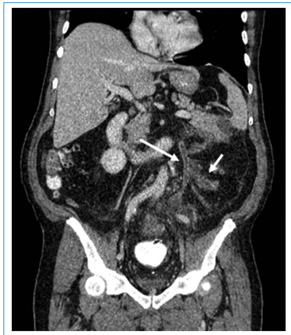
Figura 4. Reconstrucción coronal de TC de abdomen contrastada. Se visualiza una imagen hipodensa en el interior de la vena mesentérica inferior (flecha larga) y la vena cólica izquierda (flecha corta), asociado a un aumento de sus diámetros y marcados cambios inflamatorios de la grasa mesentérica periférica.

el ángulo esplénico del colon, se le efectuó hemicolectomía izquierda con creación de colostomía terminal y luego tratamiento con antibióticos y anticoagulantes en sala. Cursó con evolución clínica satisfactoria.