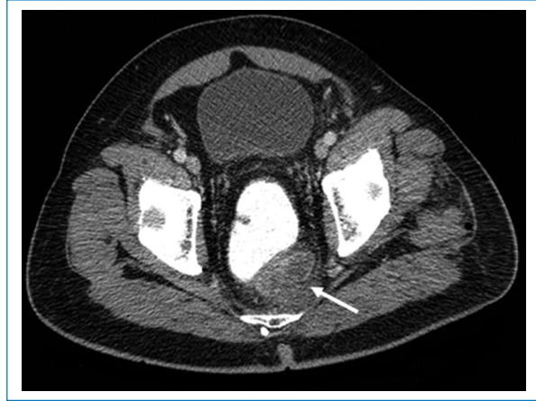
Figura 3. Cortes axiales de TC de abdomen contrastada. Se aprecia un defecto de llenado en el interior de la vena rectal superior (flecha), que condiciona un marcado aumento de calibre y tortuosidad de esta.