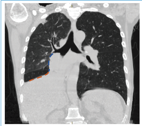
Figura 3. Tomografía computada de tórax, reconstrucción coronal con el signo de la "S" de Golden en lóbulo inferior derecho.

diagnósticos diferenciales, como metástasis pulmonares y causas extrínsecas que generen compresión bronquial; entre ellas mencionamos las masas y adenomegalias mediastinales 4 .