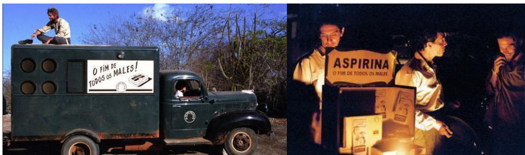
Imagem 4 e 5: Outra foto do caminhão que carregava e uma cena da sessão noturna sendo armada pela equipe técnica.

A montagem da tela – um lençol – em praças, transforma-se, sempre, em um acontecimento, de cidade em cidade, com a ajuda do breu das cidades do interior naquela época. Os pequenos filmes projetados mostram as 'maravilhas do Brasil', com foco na grande São Paulo (o que encanta o nordestino com este sonho). Mostra ainda, as mazelas cotidianas, exibindo pessoas que usam a pílula em busca do Fim para Todos os Males , slogan de vendas da aspirina. Ao término do curta-metragem, uma fila de pessoas é formada junto ao caminhão para comprar cartelas e mais cartelas desse medicamento.