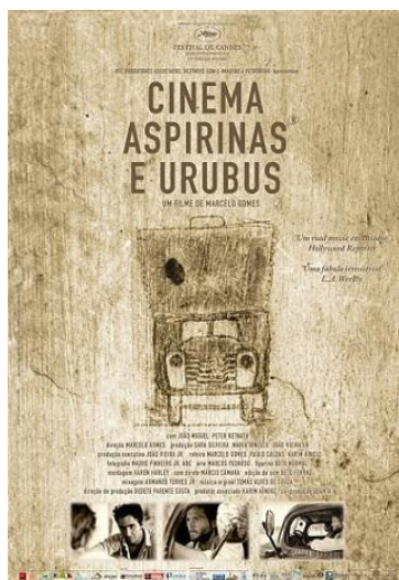
Imagem 1: Cartaz de divulgação 11

A narrativa se passa no sertão nordestino em 1942. Traz a história de um alemão que vem para o Brasil, um migrante, fugindo da situação na qual a Alemanha se encontrava, de desemprego e iniciadora do que ficou conhecido como a Segunda Guerra Mundial. Trabalha como representante da Aspirina da Bayer no Brasil e monta uma estrutura ambulante, feita com um caminhão e artefatos que permitiam a projeção de pequenos filmes - documentários que mostravam a aspirina como excelente medicamento para uma série de doenças. Ele corta o sertão, visitando pequenas cidades do interior do Brasil, passando esses filmes à noite e vendendo seu produto.