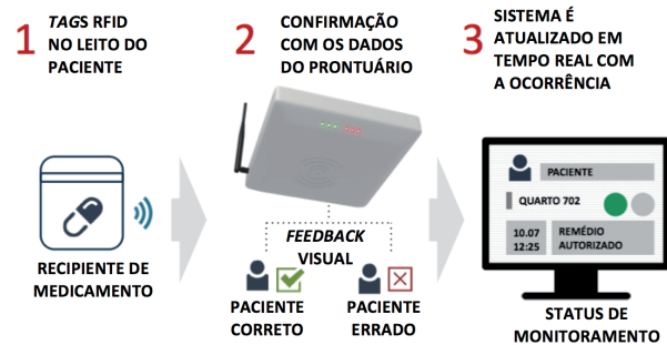
Figura 3: Processo interativo de monitoramento RFID

Dessa forma, pretende-se auxiliar os profissionais no cumprimento exato de cada medicação do paciente, realizando a confirmação eletrônica do que está prescrito no prontuário. Caso a medicação enviada ao leito do paciente não seja a mesma prescrita em seu prontuário, a própria antena RFID emitirá alerta visual no quarto e o sistema é atualizado em tempo real na enfermaria (Figura 3), buscando evitar o erro antes de ocorrer. Com isso, pode-se evitar ainda que, mesmo que o recipiente de remédios esteja de acordo com o prontuário, seja enviado em horário errado.