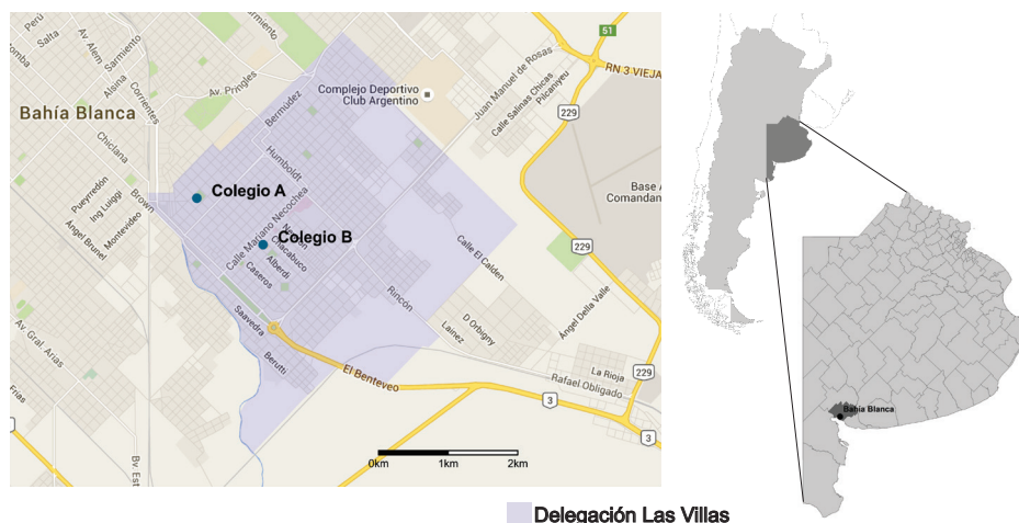
Figura 1. Área de estudio.

Se hizo necesario construir el concepto de identidad escolar tomando como puntapié la perspectiva de Hall (1996) quien define a la identidad como