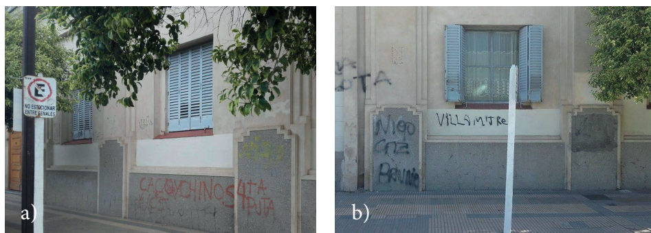
Figura 2. Marcajes de rechazo.

Cuando se valió de la observación participativa, el funcionamiento de las instituciones parece alejarse uno de otro, en un orden estructural: ambos colegios son importantes semblantes de los valores religiosos, pero sus autoridades difieren en términos de ethos y género ; por un lado, las hermanas de la Caridad en el colegio