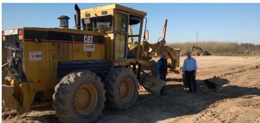
FIGURA 2. Obras ingenieriles en el predio cedido de la ACRC.

Ante este escenario, la ACRC se puso a derecho y comenzó a tomar parte en el litigio jurídico. Concretamente, presentó ante la Justicia un estudio de evaluación de impacto ambiental (EIA) donde se argumentaba, en líneas generales, que las acciones desplegadas y a realizar eran inocuas o de muy bajo impacto.