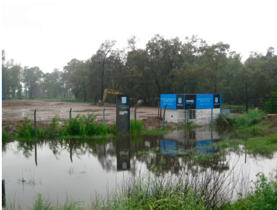
FIGURA 3. Obras ingenieriles en el predio cedido de la ACRC.