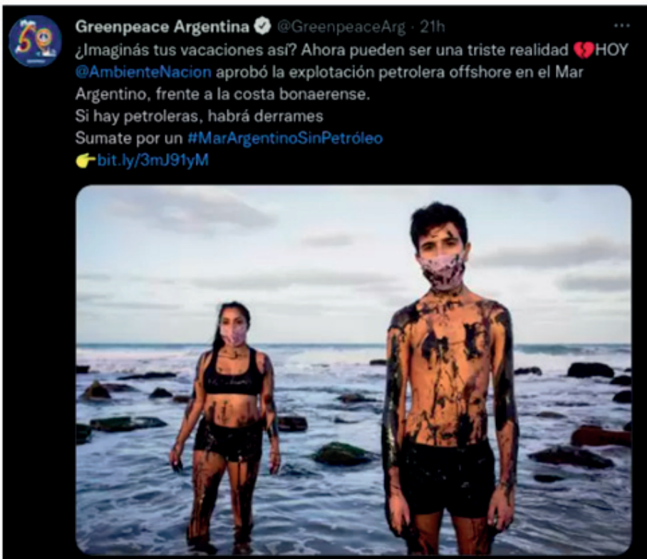
Figura 4. Imagen de la campaña que lanzó Greenpeace en redes sociales tras la aprobación del proyecto. Fuente: Cuenta Twitter oficial de Greenpeace. https://twitter.com/greenpeacearg/status/1476626837489045504

La publicación de esa resolución que daba aprobación definitiva a las exploraciones sísmicas para la búsqueda de petróleo offshore provocó la inmediata reacción de la agrupación Greenpeace que ese mismo día lanzó una fuerte campaña en redes sociales que se volvió viral (Fig. 4).