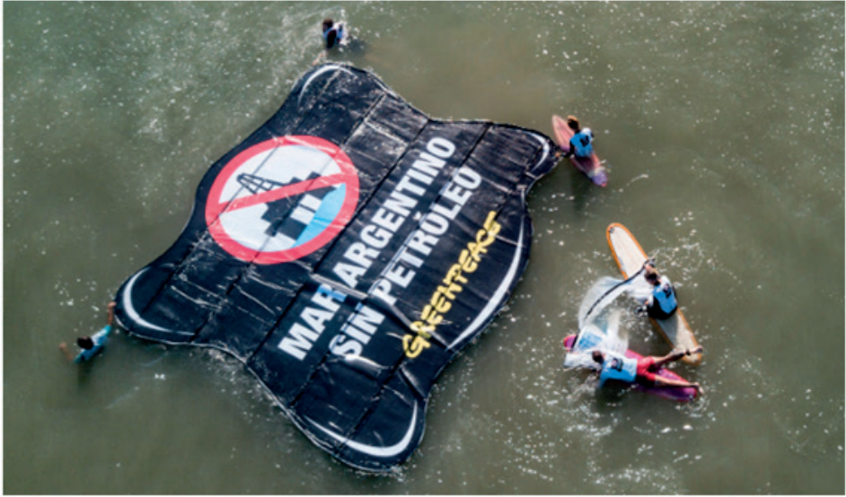
Figura 2. Simulación de una mancha de petróleo en playa Varese desarrollada por Greenpeace.