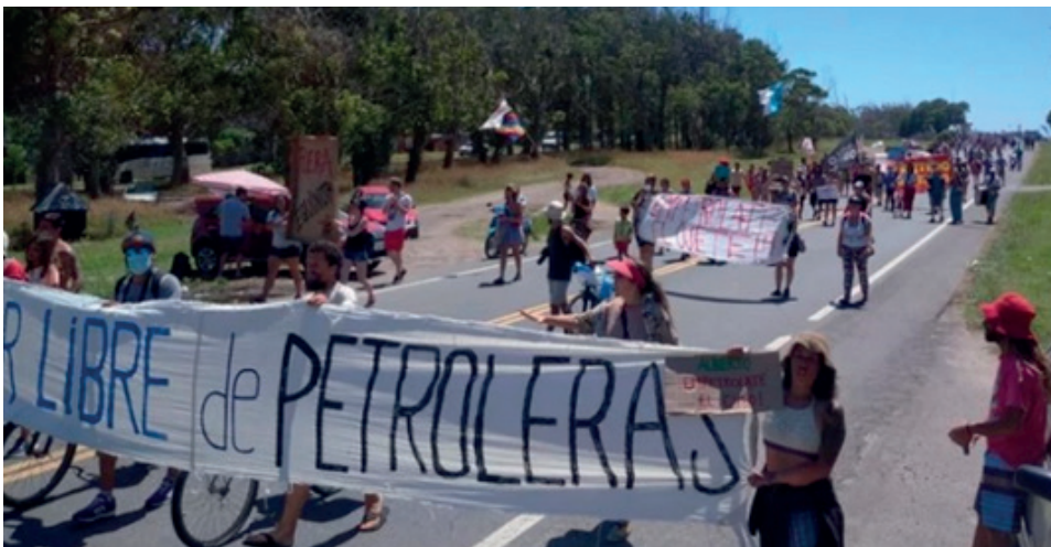
Figura 5. Imágenes de las protestas frente a la residencia oficial de Chapadmalal.

A partir de ese momento las manifestaciones en contra del proyecto se multiplicaron y no se hicieron esperar. Por esos días el presidente de la Nación, Alberto Fernández, se encontraba descansando en la residencia oficial de la localidad de Chapadmalal y el 31 de diciembre distintas organizaciones ambientalistas y ecologistas se trasladaron 25 kilómetros desde Mar del Plata hasta Chapadmalal, donde cortaron por partes la ruta 11 en protesta a la aprobación del proyecto (Fig. 5).