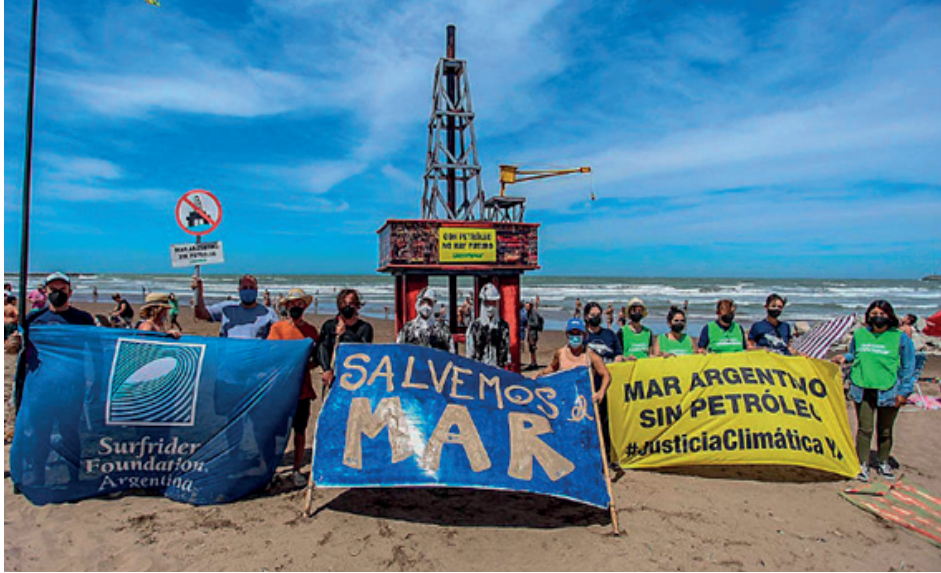
Figura 3. Recreación de una torre de petróleo en playa Grande, Mar del Plata.

En una primera instancia se procedió a solicitar información adicional a la empresa con respecto a aspectos no suficientemente desarrollados, cuestión que fue respondida y los informes adicionales fueron incorporados a la documentación original.