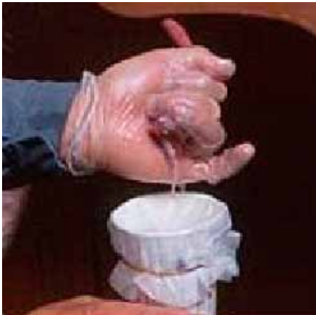
Figura 4. Obtención del semen de verraco.

coger la fracción siguiente (fracción espermática, rica en espermatozoides, reconocible como un fluido blanquecino) en un vaso de cartón tapado con gasa. Esta porción contiene el 80-90% de todas las células espermáticas presentes en el eyaculado. La emisión deberá ser recolectada hasta que su aspecto cambie a un fluido más claro y acuoso (fracción post-espermática), el cual deberá ser desechado. Es necesario llegar siempre al final de la eyaculación, que dura de 5 a 20 minutos, y esperar la retractación del pene. Por último, pulverizar el pene y el prepucio con una solución de clorhexidina para desinfectarlos. El termo deberá ser colocado (dentro de los 15 minutos posteriores a la recolección del eyaculado), en una cámara o ambiente a 37°C.