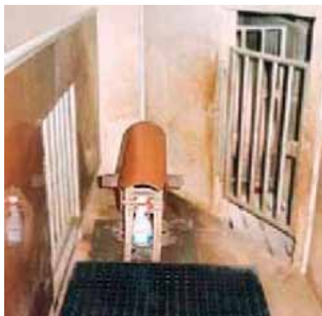
Figura 2. “Potro” para la monta del verraco.

dotado de un recubrimiento que pueda ser higienizado pero que a la vez permita conservar el olor del verraco para su estimulación 2,8 . La utilización de una alfombra en la parte trasera del potro puede evitar resbalones, permitiéndole al verraco un buen salto en el primer intento 9 .