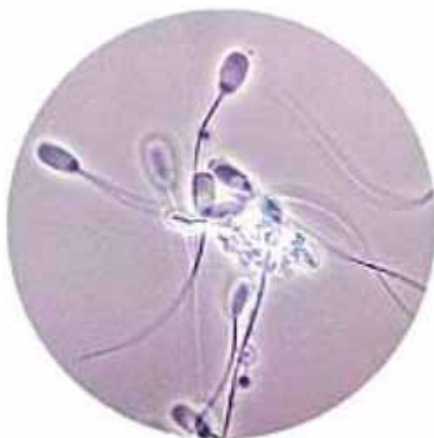
Figura 5. Espermatozoides aglutinados.

El grado de aglutinación suele medirse en una escala de 0 a 3. El grado 3 corresponde a más de un 30-40% de espermatozoides aglutinados. En algunas ocasiones, la presencia de aglutinación leve (de 0 a 2), desaparece al realizar la mezcla del eyaculado con el diluyente, merced a la estabilización química que proporciona este último, observándose posteriormente, una disminución del grado de aglutinación 1,3,8 . Entre las posibles causas de aglutinación pueden consignarse: presencia de restos de gel procedente de las glándulas bulbouretrales (filtrado defectuoso), concentración muy elevada de espermatozoides en el eyaculado, mala calidad espermática (espermatozoides muertos o con baja vitalidad), shock térmico por manipulación inadecuada del semen, contaminación bacteriana del eyaculado (bacterias resistentes a la gentamicina pueden provocar