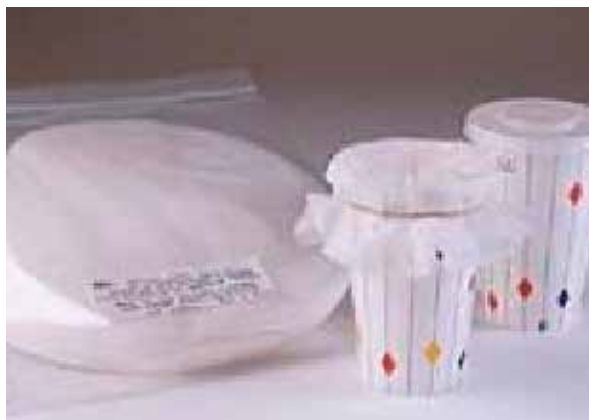
Figura 3. Vasos de cartón para coleccionar semen.

Al comienzo de la eyaculación se debe seguir apretando la extremidad del pene, aplicando presión discontinua para estimular la eyaculación. Desechar la primera parte del eyaculado (fracción pre-espermática: fluido claro, acuoso y con elevado recuento bacteriano). Re-