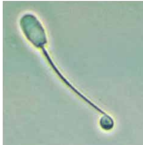
Figura 6. Gota citoplásmica distal.