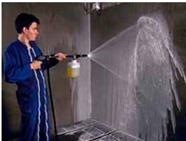
Figura 1. Desinfección mediante “cañón de espuma”.