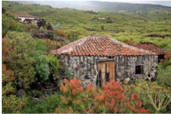
Foto 2: Casa construida con estructura de techo pie o pata de gallo 10 .

La pata o pie de gallo es una estructura de techado menos frecuente, que da un techado de cuatro aguas. Las laterales a unos 45 grados y las culatas o fronteras a 60 grados aproximadamente. La estructura principal es un trípode constituido por morrillos. Un par de patas de gallo articuladas en su vértice superior por una viga madrina en la que se sobremonta un caballete o viga cumbreira sobre el que se a su vez se apoya el enjaule. Sobre esta estructura de madera rolliza se arma la cubierta. La estructura no es atada sino trabada por un travesaño o tranca que da rigidez al elemento de soporte 9 .