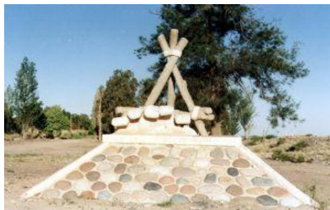
Foto 3: Monumento al pie de gallo o dique criollo en Parque Chachingo, Maipú 13 .

El concepto pie de gallo era también muy utilizado en la cultura de los pueblos vitivinícolas de Cuyo y Chile, dedicados a la agricultura intensiva con redes de riego. Los pies de gallo eran diques artesanales, utilizados para conducir el agua de los ríos a los canales de riego, originarios de la tradición indígena 12 .