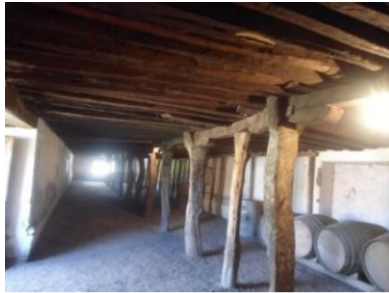
Figura 1: Dibujo de horcones soportando cumbrera 7 .

Foto 1: Alineamiento de horcones soportando los tirantes 6 .