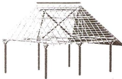
Figura 2: Estructura de entramado pie o pata de gallo 11 .

El concepto pie de gallo era también muy utilizado en la cultura de los pueblos vitivinícolas de Cuyo y Chile, dedicados a la agricultura intensiva con redes de riego. Los pies de gallo eran diques artesanales, utilizados para conducir el agua de los ríos a los canales de riego, originarios de la tradición indígena 12 .