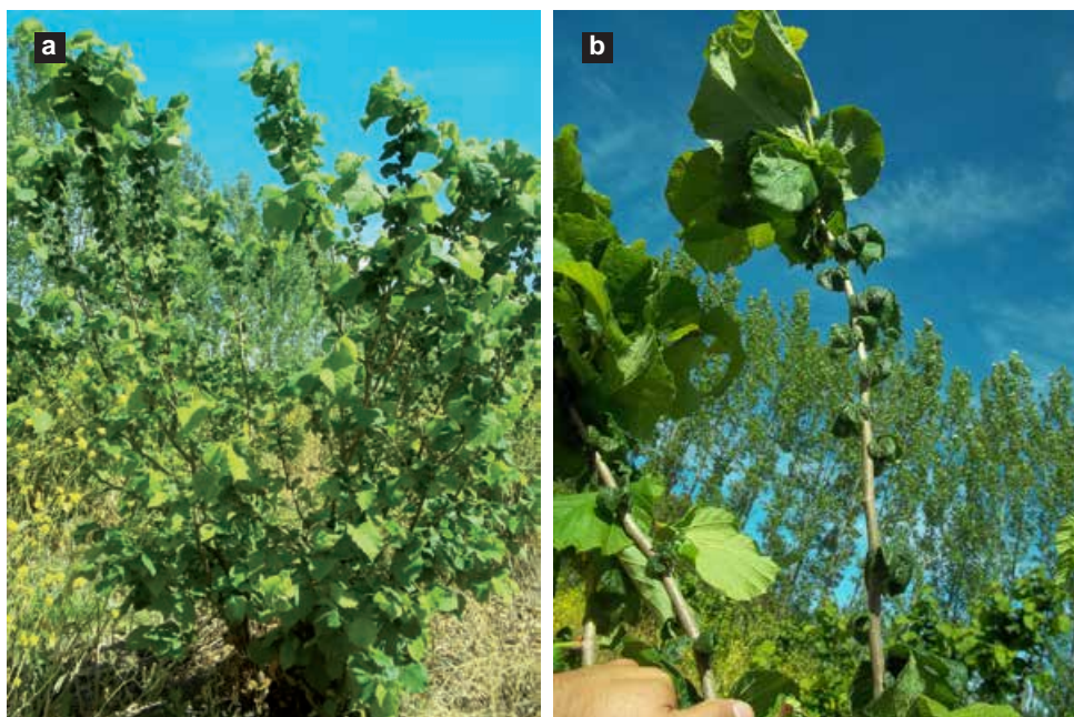
Figura 3. Síntomas provocados por T. horridus en avellano. a) Aspecto general de una planta atacada por T. horridus ; b) Rama con crecimiento anormal de brotes.

yemas vegetativas y florales. Asimismo, se prevé una disminución en el rendimiento de la próxima temporada como consecuencia de la reducción del crecimiento vegetativo en la temporada con presencia del ácaro, ya que el avellano produce sus frutos en ramas del año anterior. Esto condice con lo expuesto por Jeppson et al. (1975), quienes afirman que la especie genera daños económicos en los avellanos.