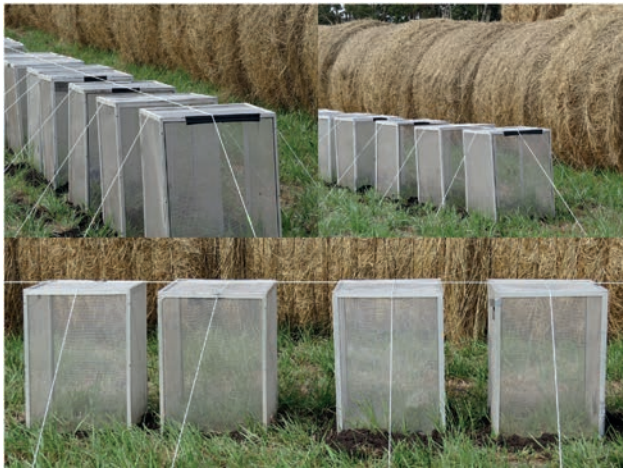
Figura 3. Jaulas de aluminio utilizadas en la experiencia.

las. Para estimar la biomasa vegetal inicial de la pastura se tomaron 5 muestras cosechando la vegetación presente en 0,25 m 2 .