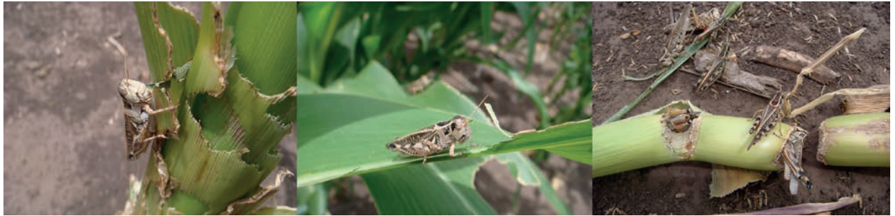
Figura 2. Individuos adultos de Dichroplus maculipennis en plantas de Maíz. Diciembre de 2009, Benito Juárez, provincia de Buenos Aires.

Además, estas investigaciones permiten tener una aproximación de las pérdidas económicas y de la disminución de la productividad de un pastizal (De Wysiecki y Sánchez., 1992; Onsager, 2000; Branson et al. , 2006).