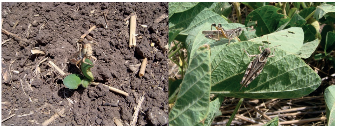
Figura 1. Individuos adultos de Dichroplus maculipennis en plantas de soja. Diciembre de 2009, Benito Juárez, provincia de Buenos Aires.

y Sánchez, 1992; Onsager, 2000; Branson, 2008). A altas densidades pueden destruir plantas enteras o grandes porciones de ellas, produciendo una disminución en la superficie fotosintética, inhibiendo la reproducción vegetativa y disminuyendo las reservas radicales (Hewitt y Onsager, 1983). En diversos estudios se ha estimado la pérdida de forraje ocasionada por diferentes especies de tucuras, determinándose que la cantidad de forraje consumido por los individuos se incrementa con los estados de desarrollo del insecto, siendo en el estado adulto cuando ocasionan la mayor pérdida (Putnam, 1962; Hewitt et al. , 1976; Hewitt, 1978; Sánchez y de Wysiecki, 1990; Bulacio et al. , 2005; Torrusio et al. , 2009; Mariottini et al. , 2011a, entre otros).