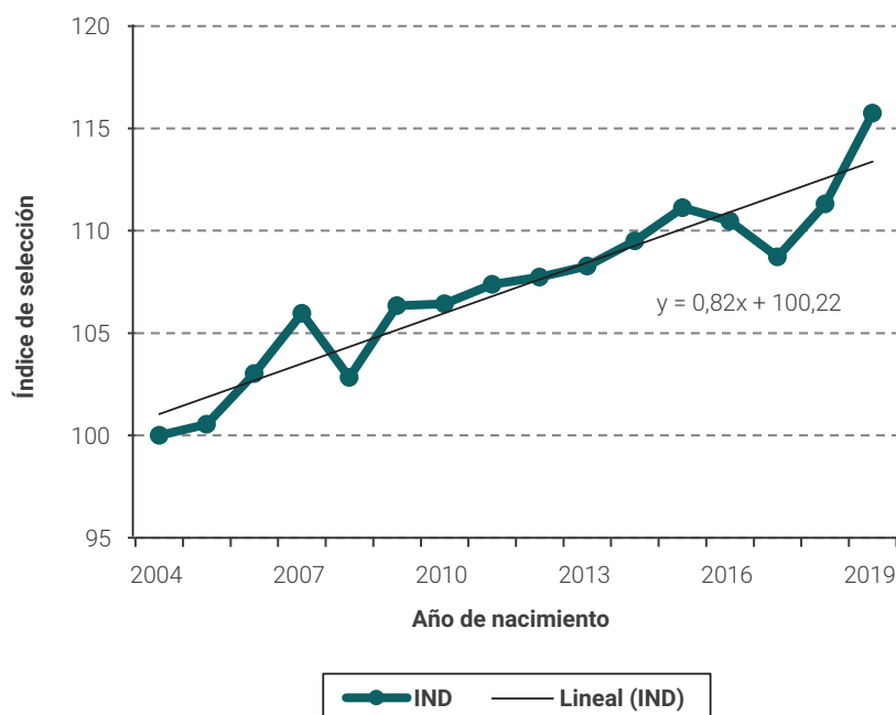
Figura 2. Tendencia genética del índice de selección (IND, pesos) que incluye pesos corporales, pesos de vellón y finura ponderados por su importancia económica. El índice se presenta estandarizado con promedio de 100 pesos para animales nacidos en el año 2004 y desvío estándar 10 pesos.