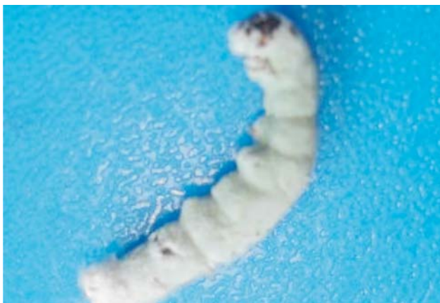
Figura 2. N. rileyi en D. saccharalis . EEAOC, 2006.