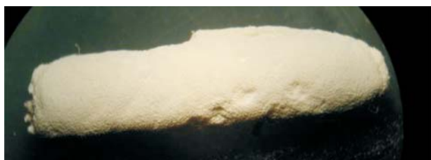
Figura 1. B. bassiana en D. saccharalis . EEAOC, 2005.

De esta primera etapa, se resalta que N. rileyi , M. anisopliae e Isaria sp. son citados por primera vez en D. saccharalis en Tucumán, Argentina.