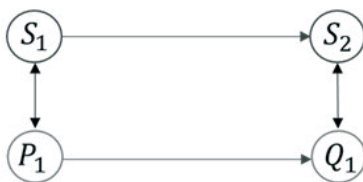
Figura 1 Modelo Nageliano de Reducción

Los defensores del modelo de la realización múltiple tomaron como blanco de ataque el modelo de reducción nageliano (Fodor 1974; Putnam 1967). Según Nagel, para que exista reducción se requiere que los términos de ambas teorías –la teoría reducida y la teoría reductora– estén conectados a través leyes puentes bicondicionales (Nagel 1961). Concretamente, para cada clase de una ciencia especial S_1 , hay una clase P_1 de la teoría reductora que es coextensivamente equivalente con ella. De esta manera, cada vez que S_1 es instanciada, también es instanciada P_1 , y viceversa (Van Riel 2014). Dicho de otro modo: S_1 es una condición suficiente y necesaria para P_1 ; y P_1 es una condición suficiente y necesaria para S_1 . Este modelo puede ser representado utilizando el siguiente diagrama (Figura 1):