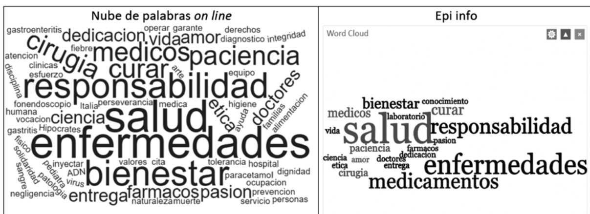
Figura 2. Nube de palabras relacionadas con Medicina.

La medicina se conecta con el sistema de salud y, por ende, con la atención de la salud de los enfermos: “En mi caso, la enfermedad es la palabra que más relaciono con el término medicina, debido a que el nivel de enfermos en la población es mayor en muchos casos, además de que el sistema de salud es el peor” (Contaduría, 27 años). Además, la medicina se considera un sinónimo de salud: “La medicina se desempeña en la salud de la persona, en los pacientes, la propia salud del doctor y todo eso. En lo que se ocupa ella es en encargarse de que todas las personas tengan buena salud, tengan buenas condiciones necesarias” (Derecho, 18 años); la salud es pilar del bienestar: “Bienestar porque el médico vela por el bienestar del paciente, la salud de la persona, trayendo consigo no solo bienestar a la persona que alivia, sino también a la sociedad a su alrededor” (Antropología, 16 años).