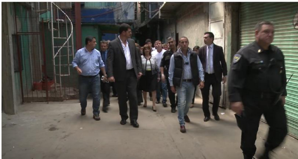
Figura 2 (YouTube MSN, 08/04/2016)

mueritos que hay” (YouTube, 08/04/2016). A la vez, tales figuras son mostradas recorriendo el territorio junto a efectivos de las fuerzas (Figura 2), representando el retorno del Estado.