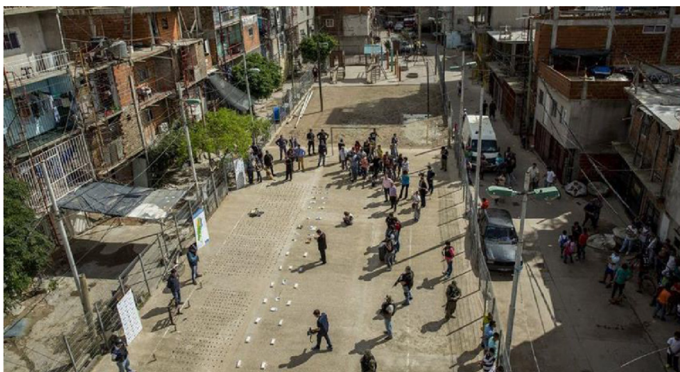
Figura 5 ( La Nación , 08/04/2016)

Otro elemento que implica una continuidad con el discurso de Cambiamos es la presentación de imágenes que exhiben el accionar policial, ya sea el allanamiento de inmuebles o la incautación de sustancias ilegales (Figura 5). En base a estos recursos, el Barrio Mugica es presentado como un territorio que busca