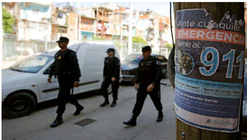
Figura 6 (14/12/2016)