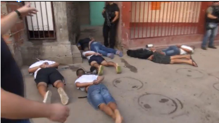
Figura 1 (Facebook MSN, 07/04/2016).

En algunos casos, son los propios funcionarios del gobierno de Cambiamos -por ejemplo, la Ministra de Seguridad de la Nación, Patricia Bullrich- quienes se refieren a la necesidad de combatir a dicho oponente para retomar el control del barrio: "el objetivo es que acá no vuelvan mañana o pasado los que venden drogas, el narcomenudeo, y que en este barrio no tengamos la cantidad de