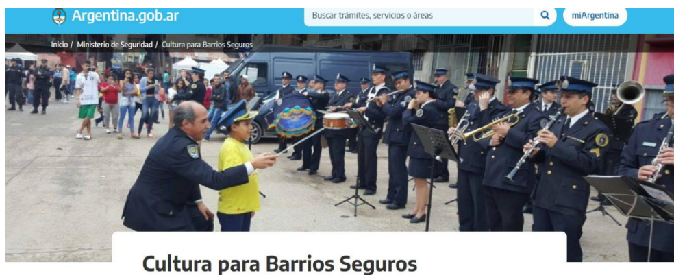
Figura 3 (Página web MSN, 09/04/2016)