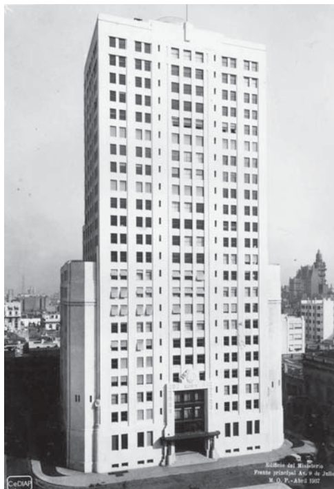
Figura 1: Edificio del MOP