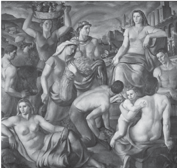
Figura 5: F. Vidal, Riqueza Nacional