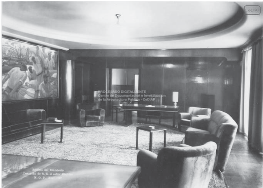
Figura 3: B. Quinquela Martín, En plena actividad

este mural de Ernesto Valls, el artista había realizado tres más para distintas dependencias de tamaño menor y tema similar. De los quince murales, más de la mitad se centran en el trabajo portuario, reforzando así el carácter de una economía donde los intercambios internacionales constituyan un pilar.