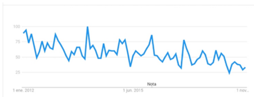
FIGURA 3 Brisas Guardalavaca en Google Trends Elaborado en Google Trends

Además, se realizó la búsqueda en Google Trends del término Hotel Brisas Guardalavaca, en el período 01/2012 – 12/2018, observándose una disminución considerable en la frecuencia de búsqueda y una tendencia a continuar de esa manera, como se muestra en la Figura 3.